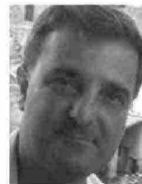
di Andrea Radic